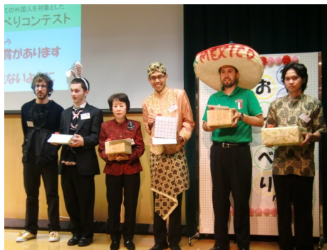
受賞された6名の発表者

少しずつ暖かくなってきましたが、みなさんいかがお過ごしでしょうか。 暖かくなるのはうれしいものの、花粉症の季節到来でもありますね。特に今年の花粉飛散量は昨年5倍～10倍だとか。薬局には花粉症対策グッズが並んでいますが、現に私もマスクと目薬が手放せません… (涙) 日本語教室のみなさんは、何か対策をとられていますか？