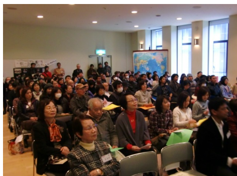
応援に来られた方々↑